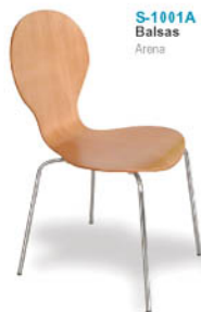
S-1001A Balsas Arena