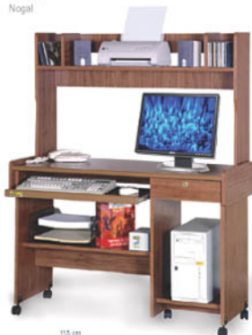
115 cm Medidas 48 cm Altura 141 cm

• Escritorios con práctica y funcional Credeza Vertical para ahorrar espacios y distribuir sus periféricos y accesorios