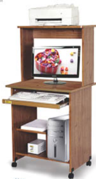
64 cm Medidas 48 cm Altura 124 cm