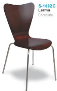
S-1002C Lerma Chocolate