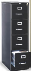
AR-MET4O Archivero Oficina Negro