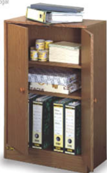
LMP610N Librero con puertas Nogal