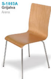
S-1003A Grijalva Arena