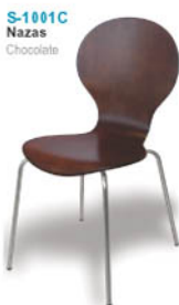
S-1001C Nazas Chocolate