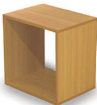
CBA Cubos Multiusos Arená

Puede ser utilizado en el hogar ó la oficina