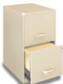
AR-MET2 Archivero 2 gavetas Avellaná