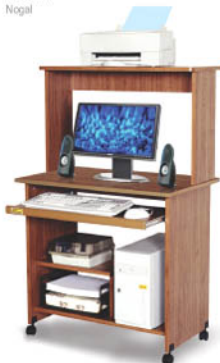
75 cm Medidas 48 cm Altura 124 cm