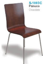
S-1003C Pánuco Chocolate