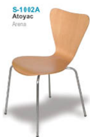
S-1002A Atoyac Arena

• Sillas en madera estructurada y soporte tubular cromado