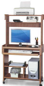
79 cm Medidas 48 cm Altura 139 cm