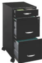
AR-MET3N Archivero Carta 1 Cajón, 2 Gavetas Negro