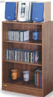
LME600N Librero entrepaños Nogal